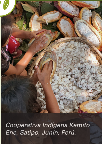
Cooperativa Indígena Kemito Ene, Satipo, Junín, Perú.