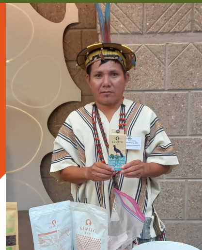
El Presidente de Kemito Ene muestra algunos de los productos de la cooperativa en un evento internacional.