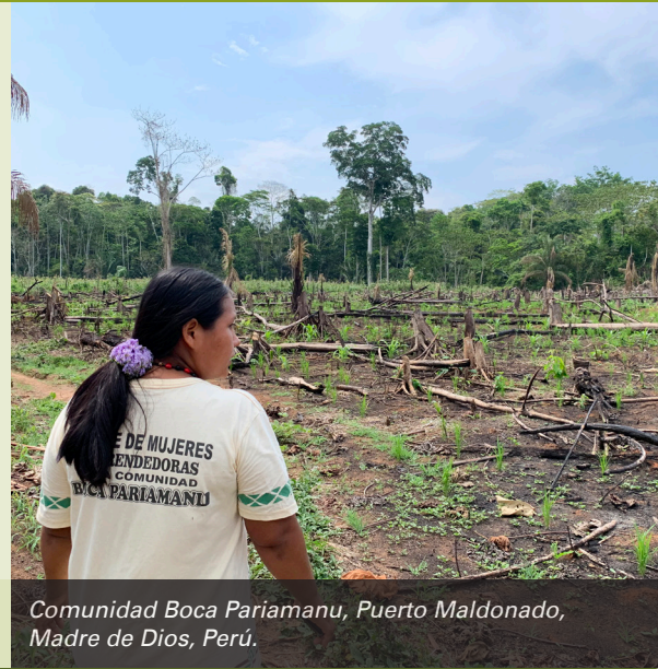
Comunidad Boca Pariamanu, Puerto Maldonado, Madre de Dios, Perú.

Imagen de visita a la Comunidad Boca Pariamanu, Madre de Dios, en setiembre 2023.