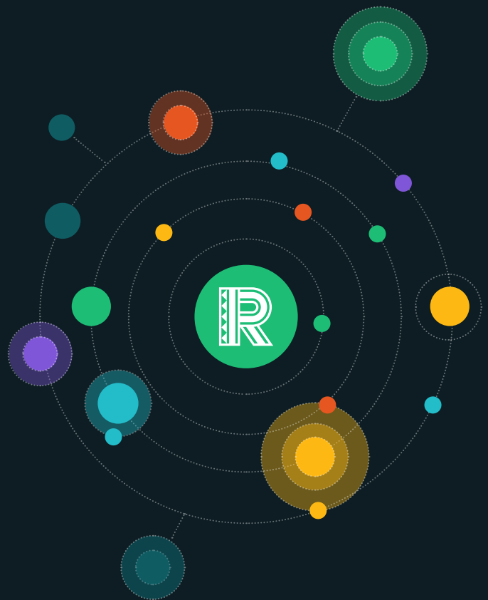
Ilustración del tamaño, crecimiento, tipología y número de entidades aliadas de la sociedad civil y de los pueblos indígenas en relación con la RFUK